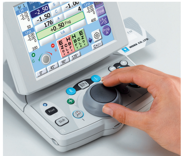
Intelligente Bedienerunterstützung mit TS-310